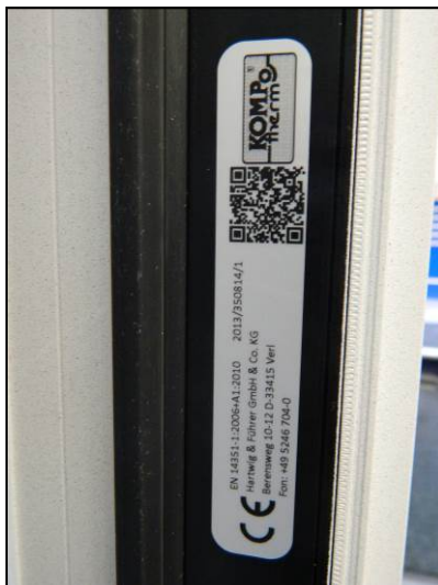
Im Türflügel auf der Bandseite mittig bzw. mittig zum mittleren Band.

Grundsätzlich positionieren wir die CE-Etiketten im Falz des Türflügels oder bei Festeilen im Glasfalz.