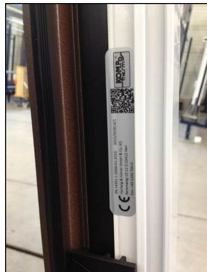
Im Festeil mittig rechts (nach Demontage der Glasleiste).